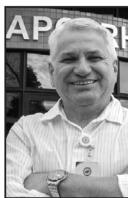
By Dr. Altair Antonio Valloto Superintendente Técnico da APCBRH

Que momento maravilhoso aconteceu neste mês de maio, tivemos a oportunidade de homenagear mais de 140 associados, durante o Jantar dos Criadores Destaques 2024.