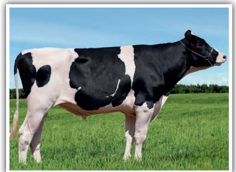
EM DESTAQUE O TOURO LARS-ACRES SSI B JUTTE-ET