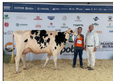
3ª MELHOR FÊMEA JOVEM GRANJA REBELATTO 265 HANLEY CRIADOR/EXPOSITOR: ADEMIR ANGELO REBELATTO MODELO/SC