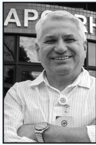
By Dr. Altair Antonio Valloto Superintendente Técnico da APCBRH

Pessoal, finalmente voltamos a ter boas notícias no campo. O preço do leite ao produtor está melhorando, e o mercado de animais também está mais aquecido. É justamente sobre isso que queremos conversar com vocês.