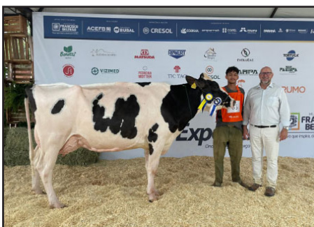
RESERVADA GRANDE CAMPEÃ GRANJA REBELATTO 244 HOTLINE CRIADOR/EXPOSITOR: ADEMIR ANGELO REBELATTO MODELO/SC