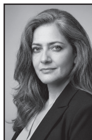
By Helô Costa Editora

Vem aí mais uma edição cheia de informação, novidades e histórias que inspiram no campo!