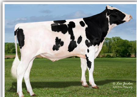
EM DESTAQUE O TOURO PEAK ALTACOLLABORATE-ET