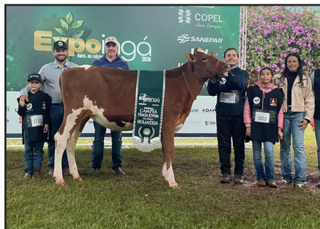
RESERVADA FÊMEA JOVEM ADRIMAR BEATRIX HINDSIGHT 2137 DÉCIO POMBALINO PRECIZO CIANORTE-PR